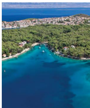
Slika 7: Ljekoviti otok Lošinj