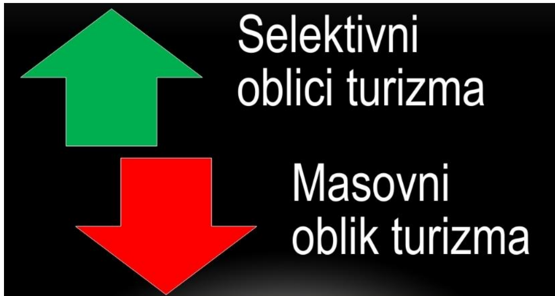
Slika 2: Ilustracija trenda turizma, prebacivanje na selektivne oblike turizma

Kroz povijest pa sve do danas obilježje turizma je masovnost, no sve više dolazi do važnosti interdisciplinarnog pristupa turizmu kojim shvaćamo istraživanjem pozitivnih i negativnih čimbenika koji proizvodi. S obzirom na brojke koje je počeo proizvoditi masovni turizam danas se vidi rješenje u selektivnim oblicima turizma gdje upravo tema rada spada u ovu kategoriju.