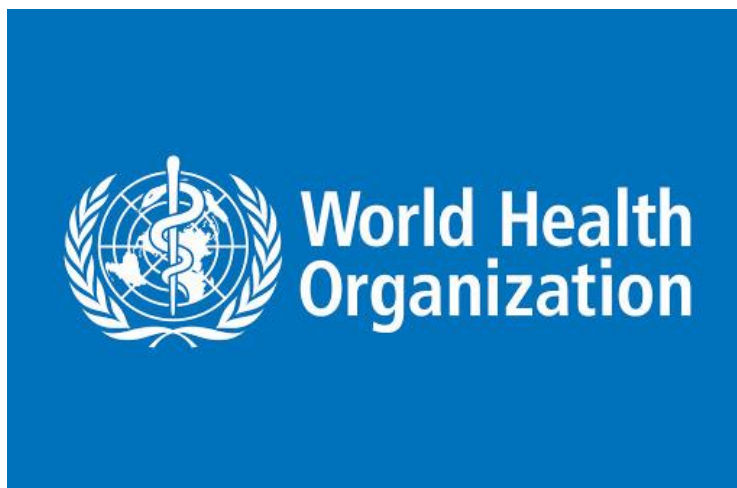
Slika 4: Svjetska zdravstvena organizacija(WHO)