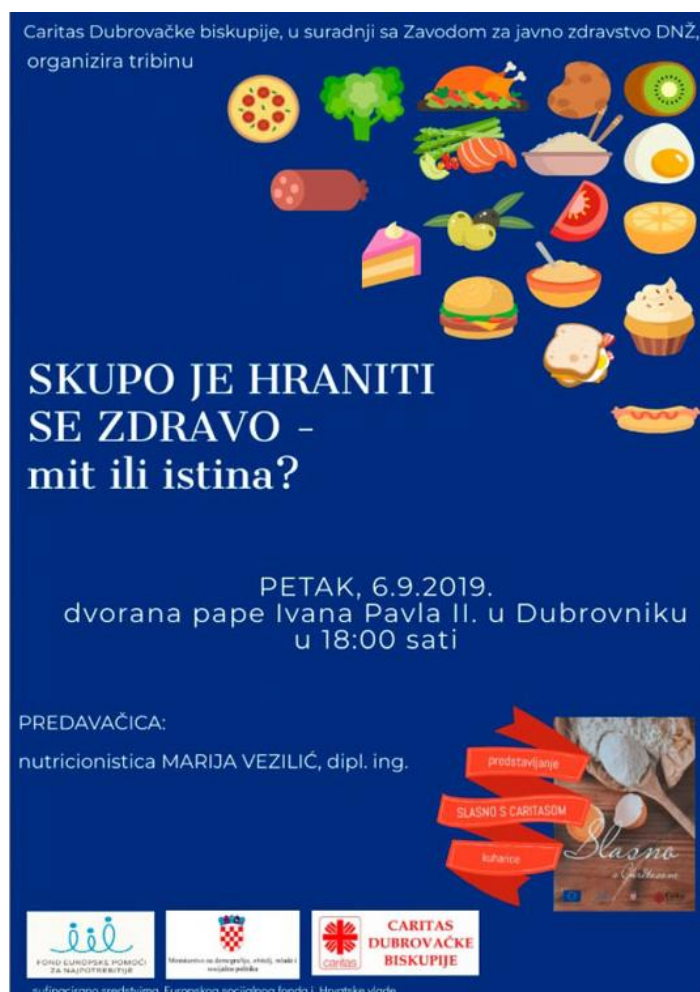
Slika 6. plakat Skupo je hraniti se zdravo- mit ili istina?