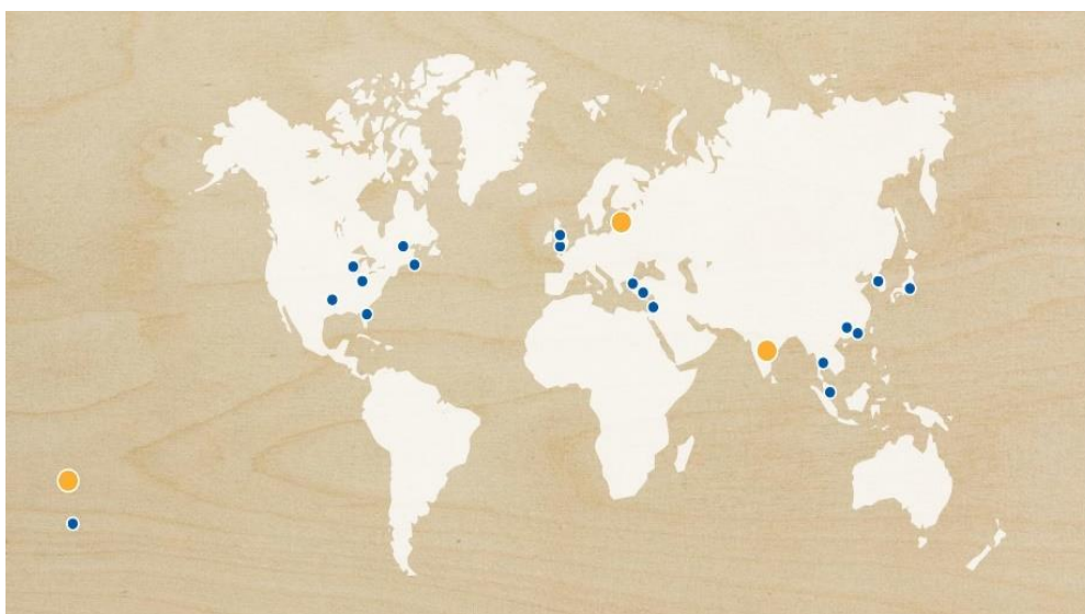
Slika 4. IKEA činjenice i brojke za 2018.