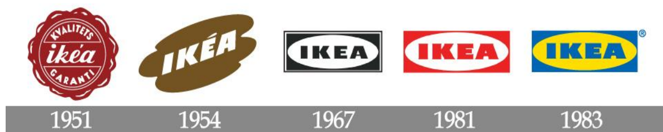
Slika 5. IKEA logotip tijekom povijesti