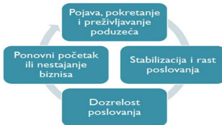
Slika 1. Životni ciklus obiteljskog poduzeća