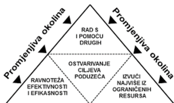
Slika 1. Ključni aspekti menadžerskog procesa