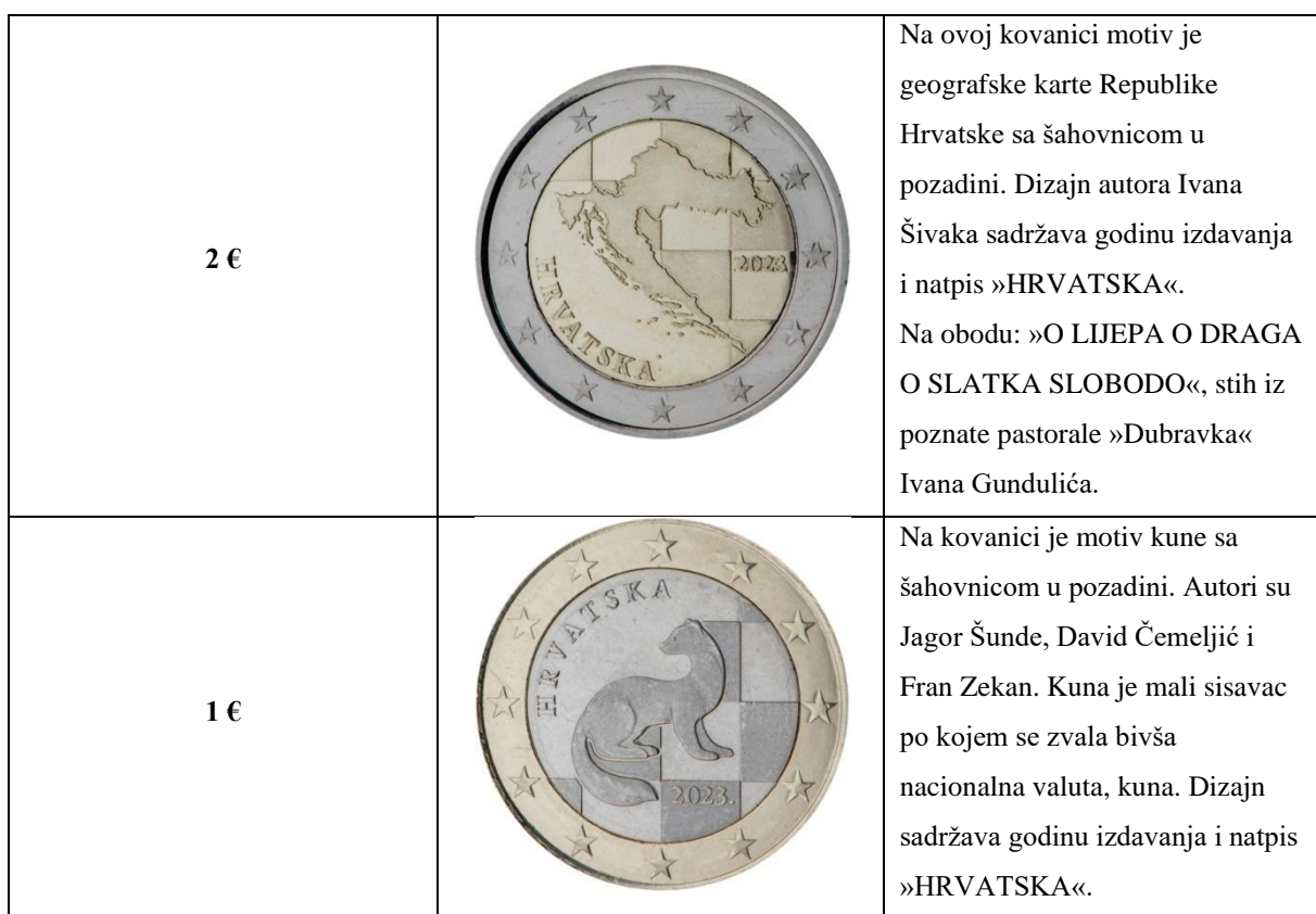
Tablica 3. Hrvatske eurokovanice

Hrvatska je odabrala četiri prijedloga dizajna nacionalne strane eurokovanica koji sadržavaju motive sa hrvatskom šahovnicom u pozadini te je na svim kovanicama prikazano 12 zvijezda europske zastave.