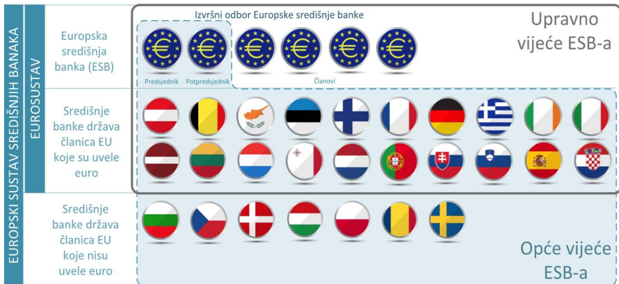
Slika 2. Europska središnja banka, Eurosustav i Europski sustav središnjih banaka i tijela za odlučivanje