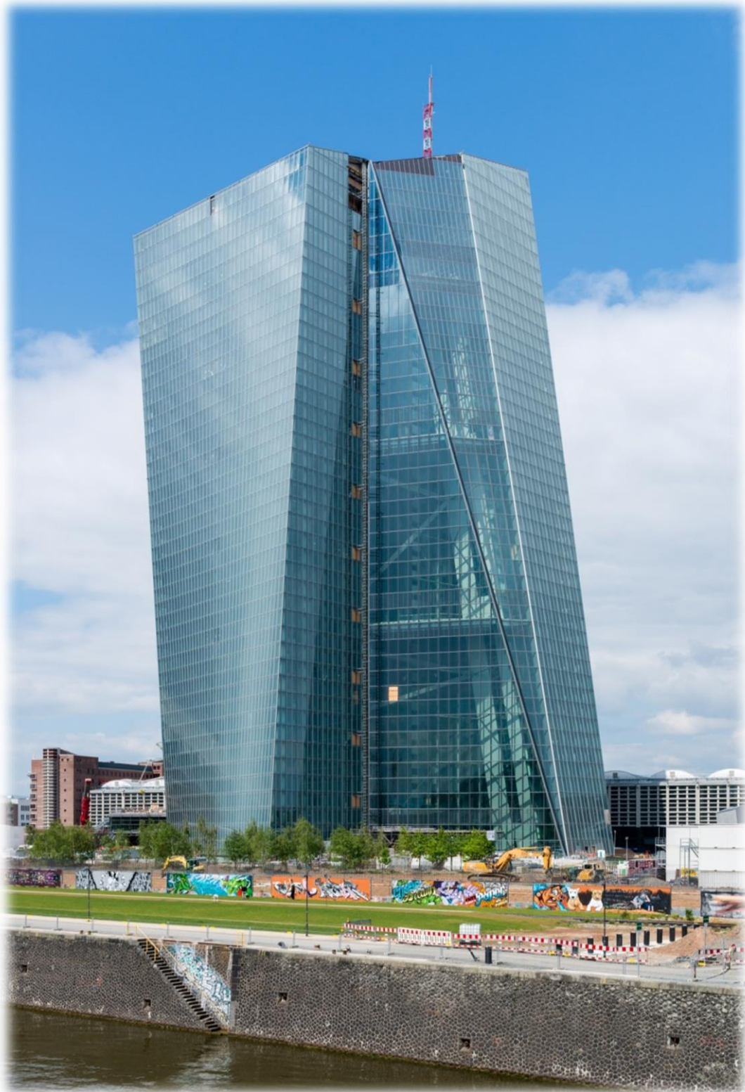
Slika 1. Europska središnja banka