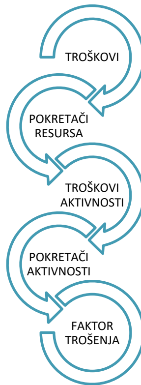
Slika 1. Struktura ABC metode

Izvor: Greenwood, T. G., & Reeve, J. M. (1992). Activity-based cost management for continuous improvement: a process design framework. Journal of Cost Management , 5(4), str. 33.