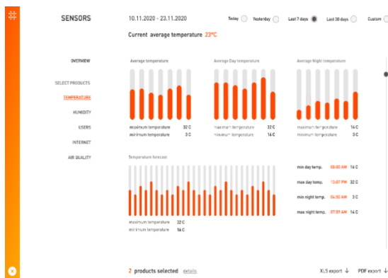
Slika 1. Dizajn sučelja od senzora s klupe

Hrvatska start-up firma sa sjedištem u Solinu proizvodi rješenja za pametne gradove koja se baziraju na obnovljivim izvorima energije radi smanjivanja zagađenja zraka i okoline. Proizvod po kojem su poznati je pametna klupa ( smart bench ) koja radi na solarni izvor napajanja. Klupa omogućuje korisniku pristup internetu, punjenje raznih uređaja, praćenje kvalitete zraka te fizikalnih parametara vremena kao što su vlaga, temperatura i tlak. Takvi podaci mogu poslužiti za monitoring kvalitete zraka na zadanoj lokaciji te eventualno alarmirati zadužene službe o mogućim većim onečišćenjima. Također inovativan je proizvod po tome što je dizajniran s LCD ekranom koji može poslužiti kao oglasna ploča i davati informacije turistima koje su potrebne da bi lakše se snalazili na lokaciji gdje je pametna klupa ugrađena.