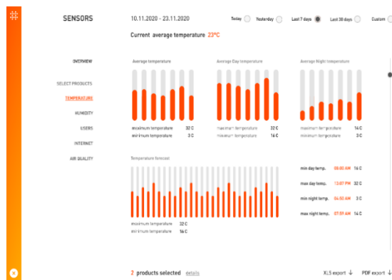
Slika 1. Dizajn sučelja od senzora s klupe

Hrvatska start-up firma sa sjedištem u Solinu proizvodi rješenja za pametne gradove koja se baziraju na obnovljivim izvorima energije radi smanjivanja zagađenja zraka i okoline. Proizvod po kojem su poznati je pametna klupa ( smart bench ) koja radi na solarni izvor napajanja. Klupa omogućuje korisniku pristup internetu, punjenje raznih uređaja, praćenje kvalitete zraka te fizikalnih parametara vremena kao što su vlaga, temperatura i tlak. Takvi podaci mogu poslužiti za monitoring kvalitete zraka na zadanoj lokaciji te eventualno alarmirati zadužene službe o mogućim većim onečišćenjima. Također inovativan je proizvod po tome što je dizajniran s LCD ekranom koji može poslužiti kao oglasna ploča i davati informacije turistima koje su potrebne da bi lakše se snalazili na lokaciji gdje je pametna klupa ugrađena.