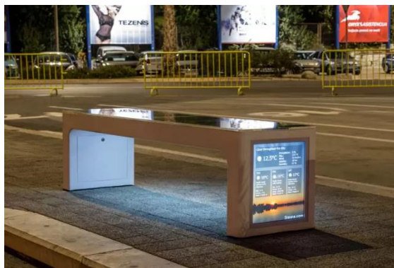
Slika 12. Pametna klupa