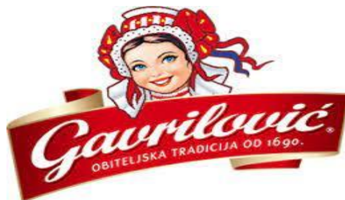
Slika 5 Logo Gavrilović