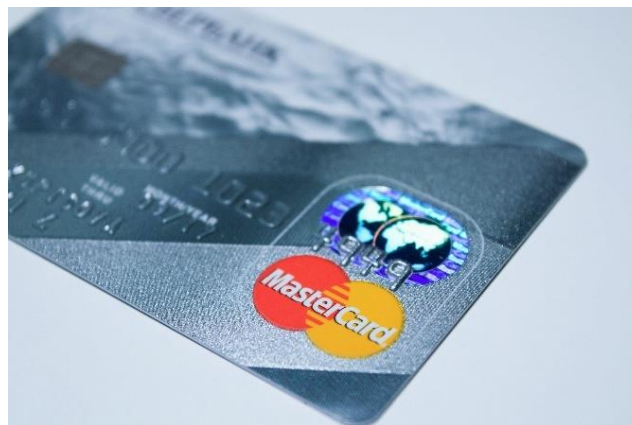
Slika 11. Mastercard