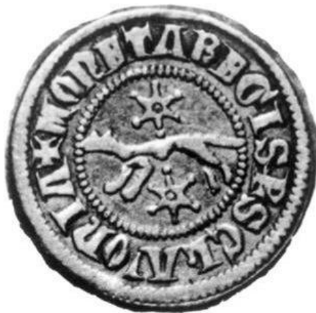
Slika 2. Srebrni banovac