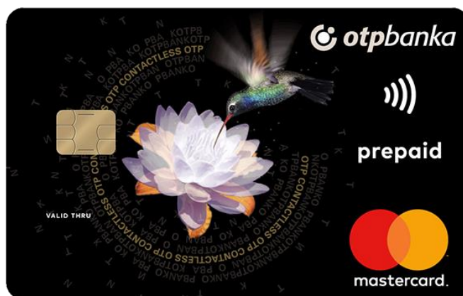
Slika 8. Prepaid card