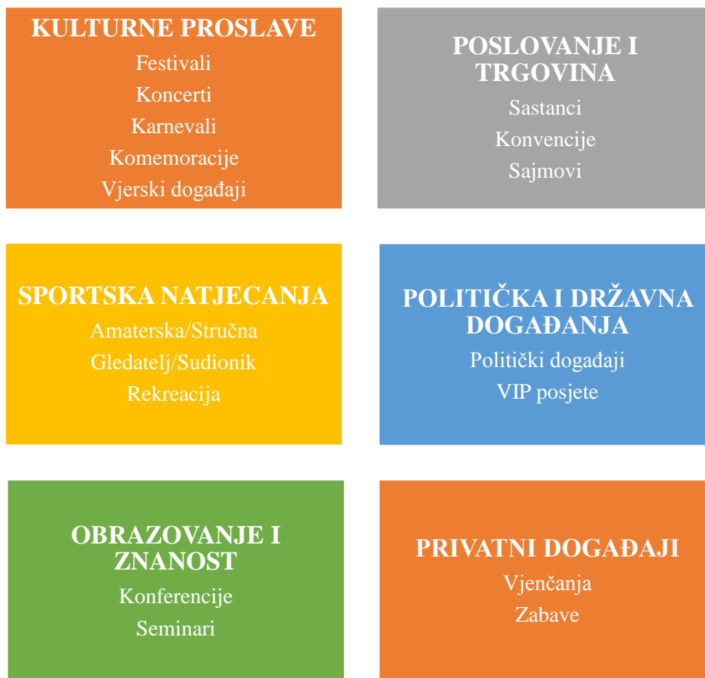
Slika 2. Vrste planiranih događaja