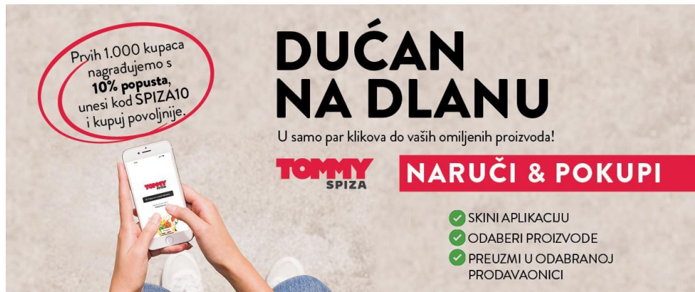
Slika 3. Dućan na dlanu

Na slici 3. nalazi se promidžbeni letak za novi proizvod Tommy d.o.o. naziva Dućan na dlanu koji predstavlja aplikaciju preko koje kupac naruči, plati i preuzme proizvode u željenoj prodavaonici.