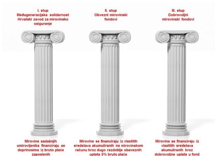
Slika 5. Sustav mirovinskog osiguranja